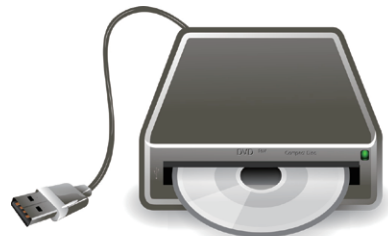
②外付け DVD ドライブ