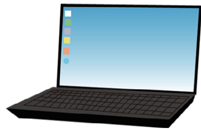
①ノートパソコン本体