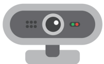
④外付カメラ (オンライン授業用)