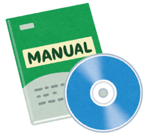
③付属の説明書や CD など