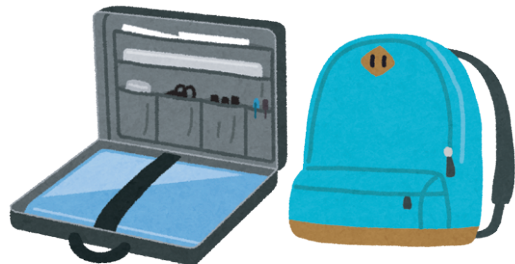
(①～⑥をバッグに入れる)