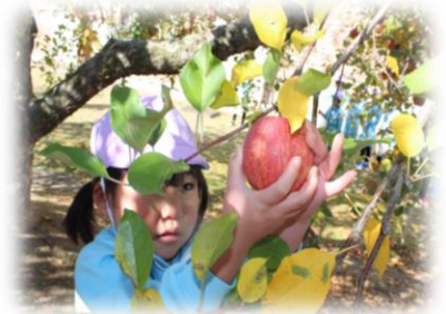
大学キャンパス内でのりんご狩り体験(全園児)