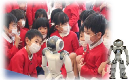
AIロボット『NAO』を活用した特別保育イベント (令和4年度年中・年長児特別保育)