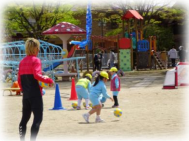
年長児が取り組む運動教室 (本学連携 AC 福島ユナイテッド)